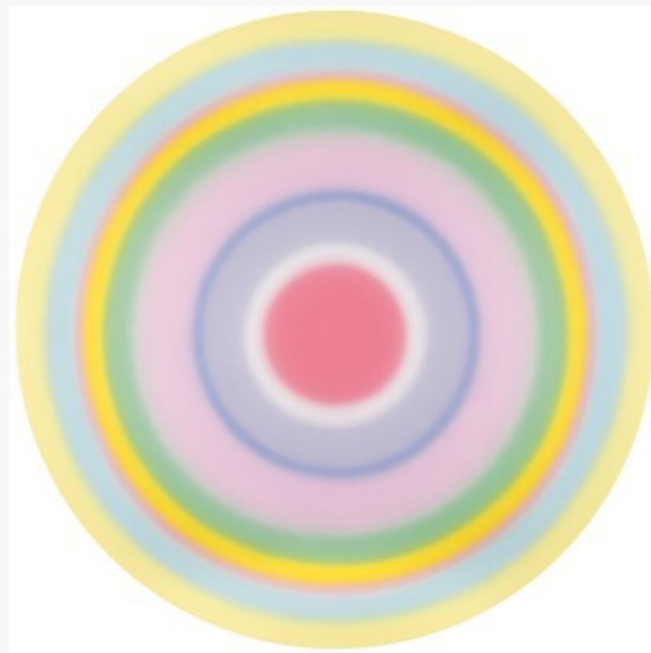
Ugo Rondinone, 1963 VIERZEHNTEROKTOBERZWEITAUSENDUNDNULL